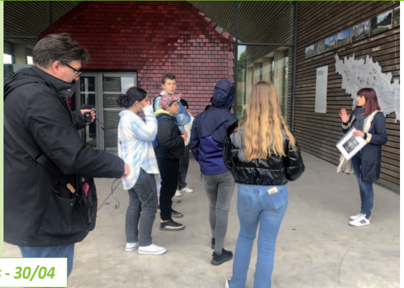
Atelier radio du PRE à la Cité des Électriciens - 30/04