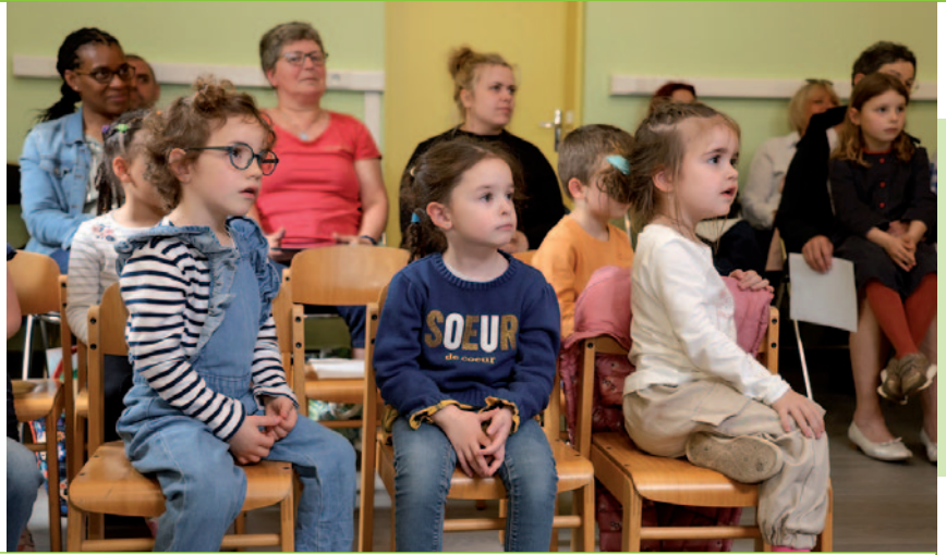
L'Heure du Conte pour les petits à la Médiathèque Marcel Wacheux - 15/05