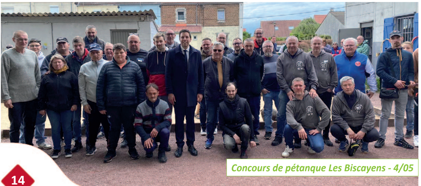
Concours de pétanque Les Biscayens - 4/05