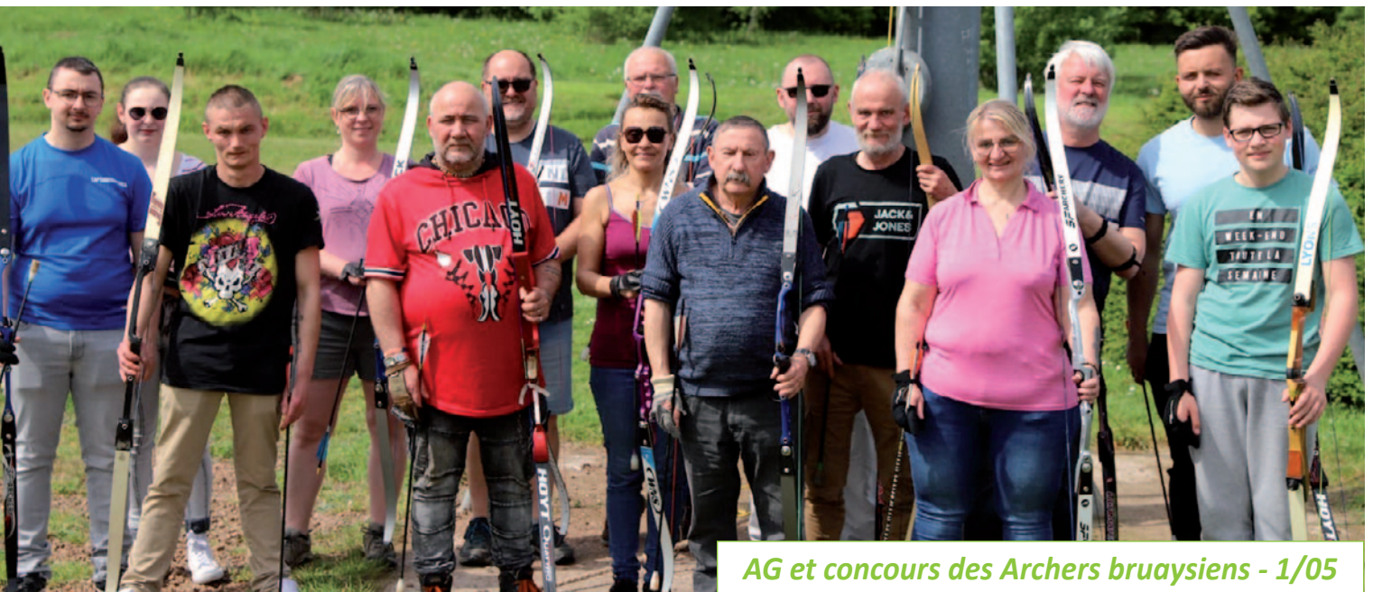
AG et concours des Archers bruaysiens - 1/05