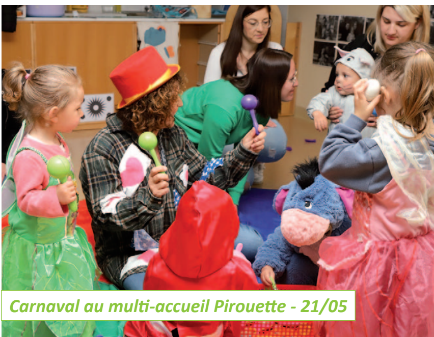
Carnaval au multi-accueil Pirouette - 21/05