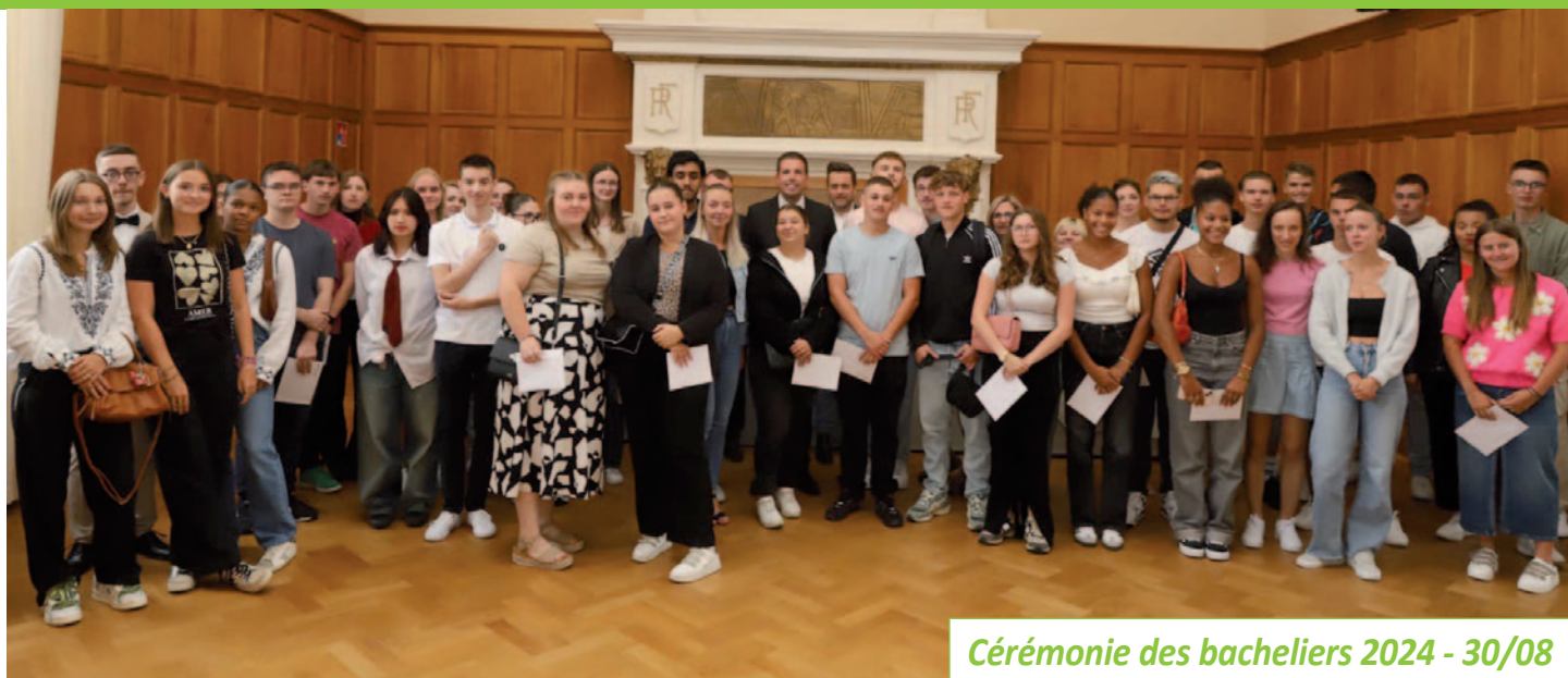
Cérémonie des bacheliers 2024 - 30/08