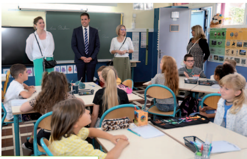
Rentrée scolaire - 2/09