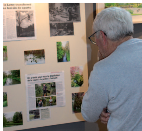
Vernissage de l'exposition de l'association Bruacum, "La Lawe dans tous ses États" à la Médiathèque Marcel Wacheux à l'occasion des Journées du patrimoine - 21/09