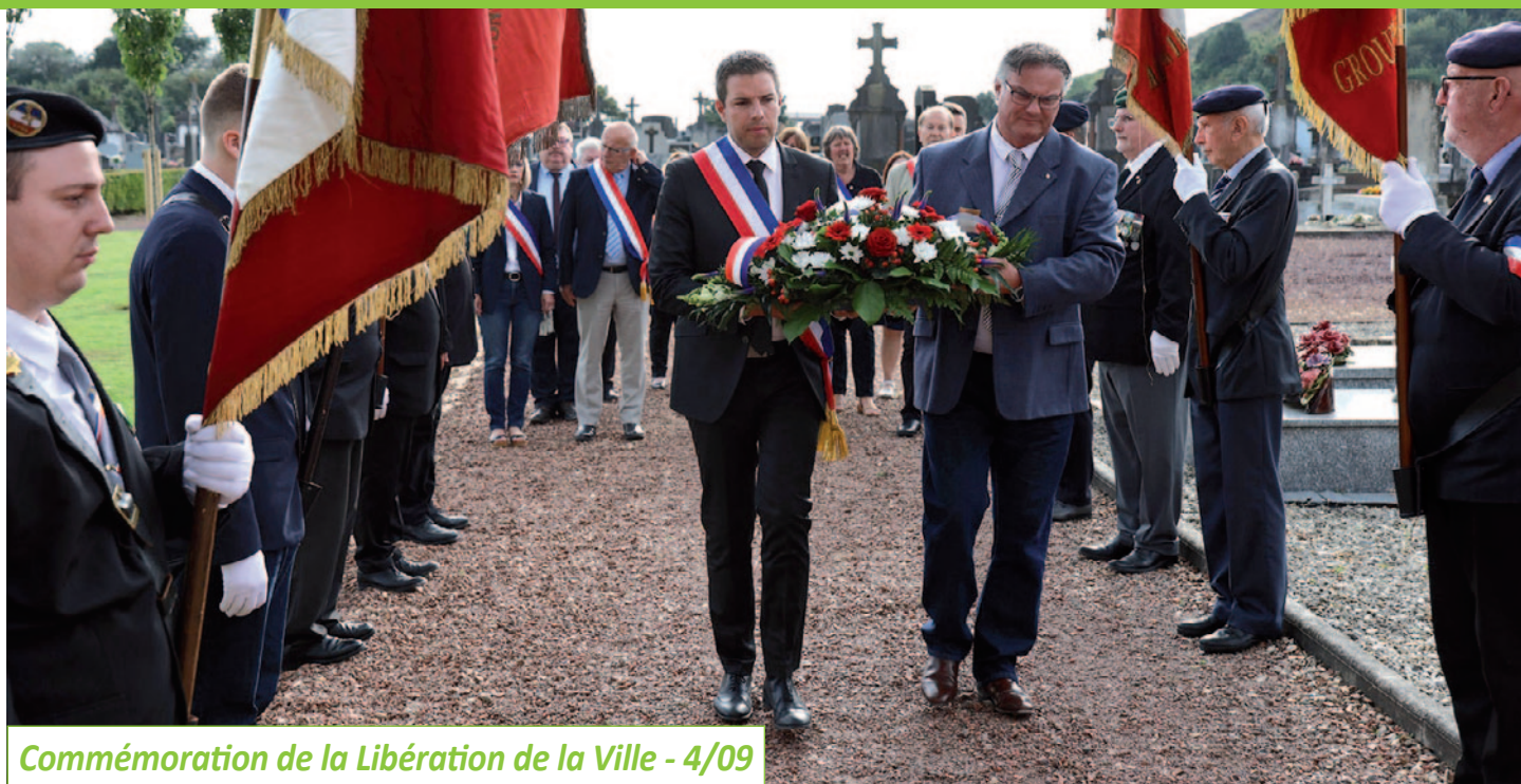
Commémoration de la Libération de la Ville - 4/09