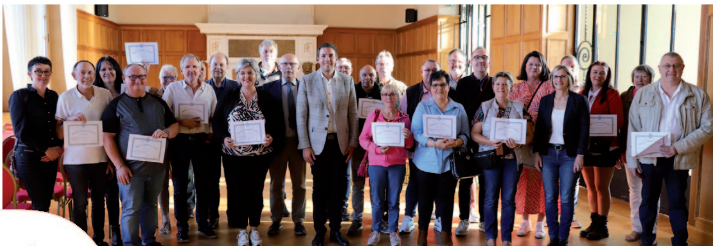
Cérémonie des décorés du travail - 18/09