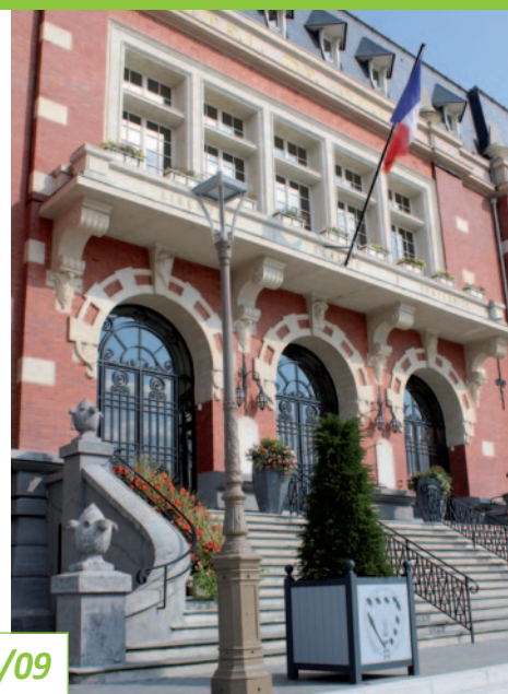
Visites de l'Hôtel de Ville à l'occasion des Journées du patrimoine - 21 & 22/09