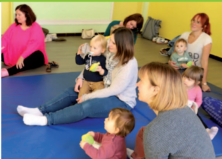
Atelier des tout-petits à la Médiathèque Marcel Wacheux - 14/09