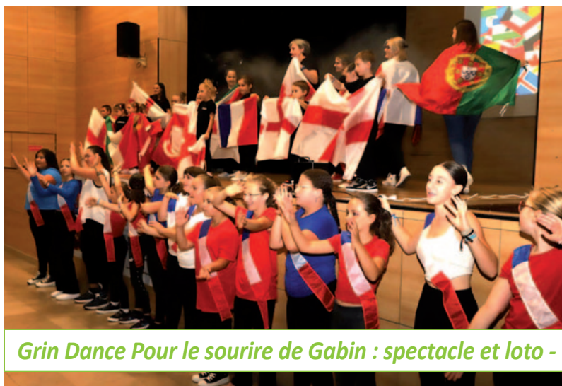
Grin Dance Pour le sourire de Gabin : spectacle et loto - 7 & 8/09