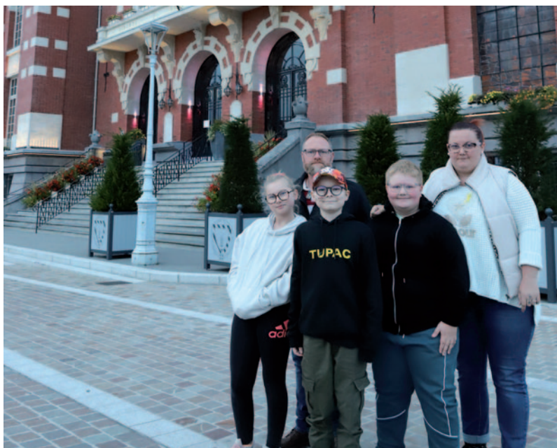
Illumination de l'Hôtel de Ville en jaune pour les cancers pédiatriques - 15/09