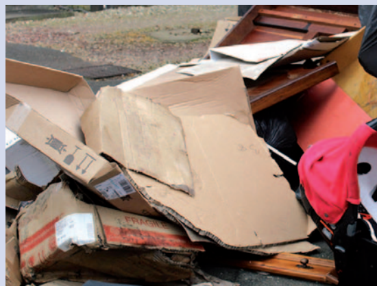
Bruay-La-Buissière lutte contre les dépôts sauvages