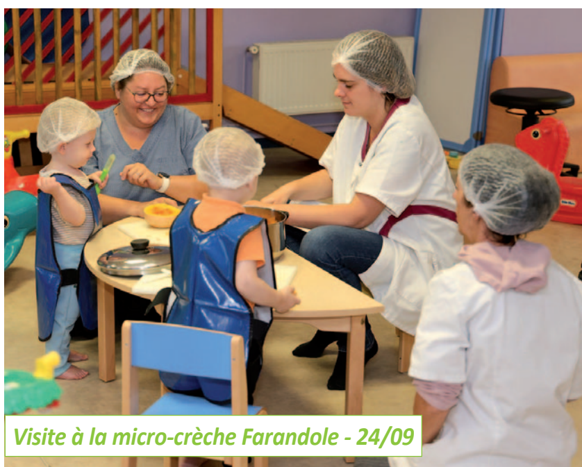
Visite à la micro-crèche Farandole - 24/09