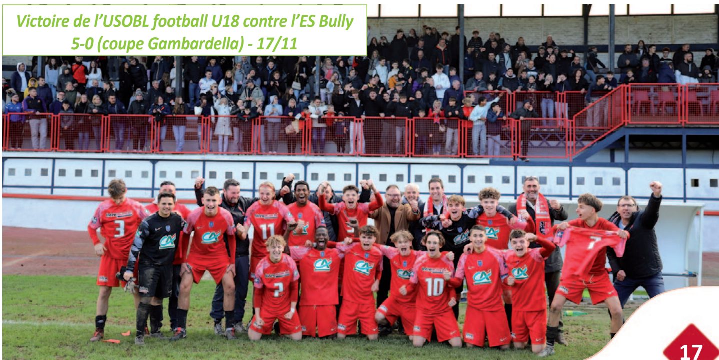
Victoire de l'USOBL football U18 contre l'ES Bully 5-0 (coupe Gambardella) - 17/11