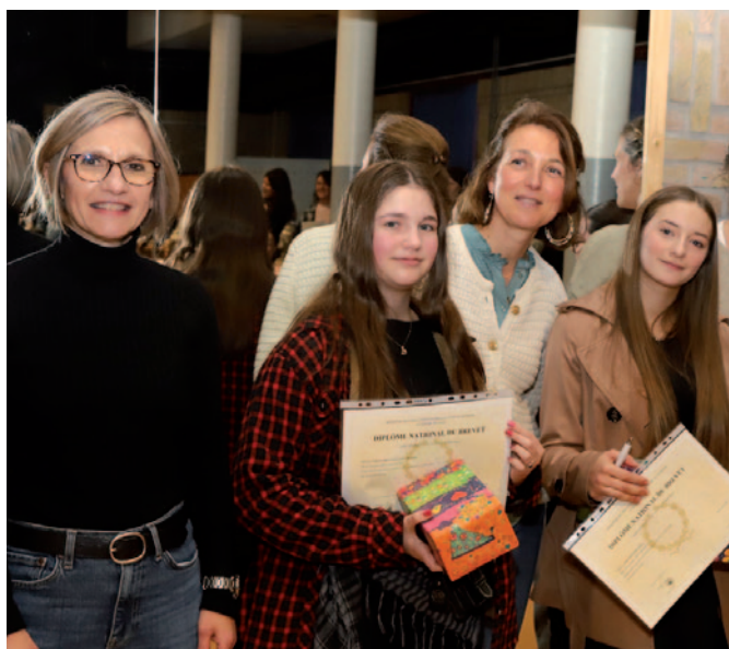
Remise du diplôme national du brevet au collège Signoret - 8/11