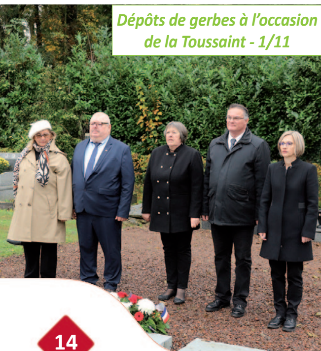
Dépôts de gerbes à l'occasion de la Toussaint - 1/11