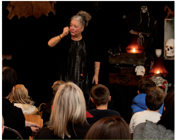
Contes d'Halloween à la médiathèque - 30/10