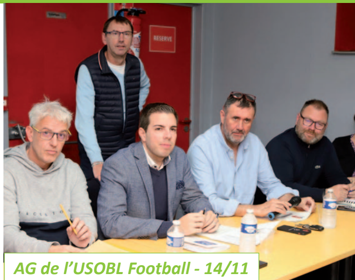
AG de l'USOBL Football - 14/11