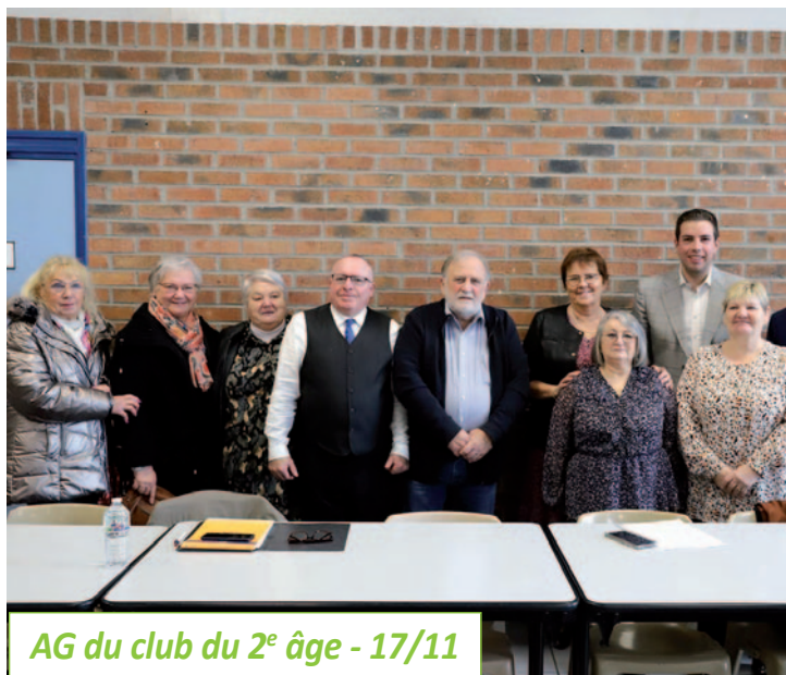
AG du club du 2 e âge - 17/11