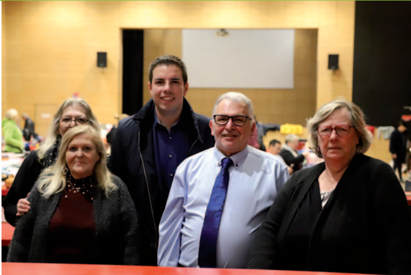
Bourse multicollections du comité du Renouveau - 9/11