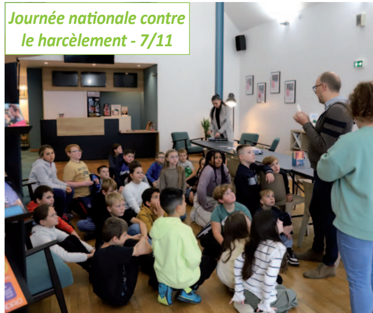
Journée nationale contre le harcèlement - 7/11