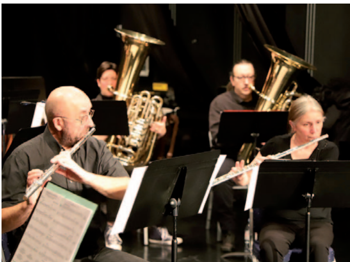
Concert de la Sainte-Cécile de l'harmonie municipale de Bruay-La-Buissière - 16/11