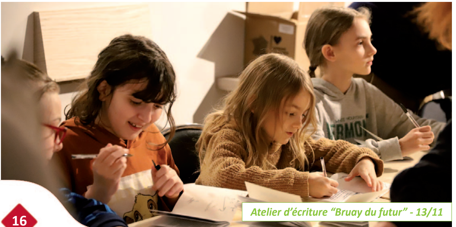
Atelier d'écriture "Bruay du futur" - 13/11