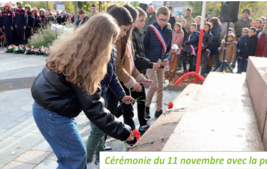
Cérémonie du 11 novembre avec la participation des écoliers de la Ville