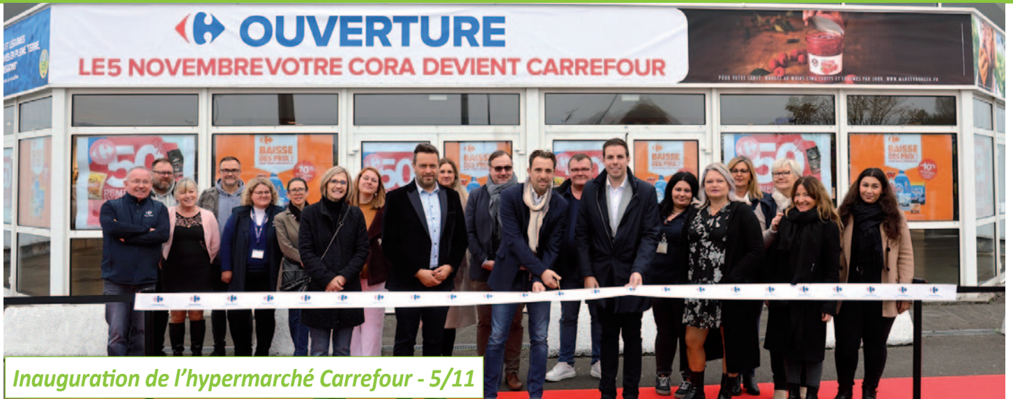
Inauguration de l'hypermarché Carrefour - 5/11