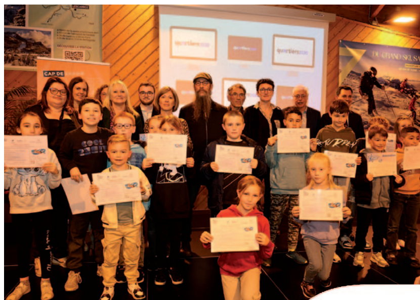
Remise des diplômes "J'apprends à nager" - 8/11