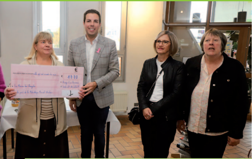
Remise de chèque à la Maison des Aveugles - 26/10