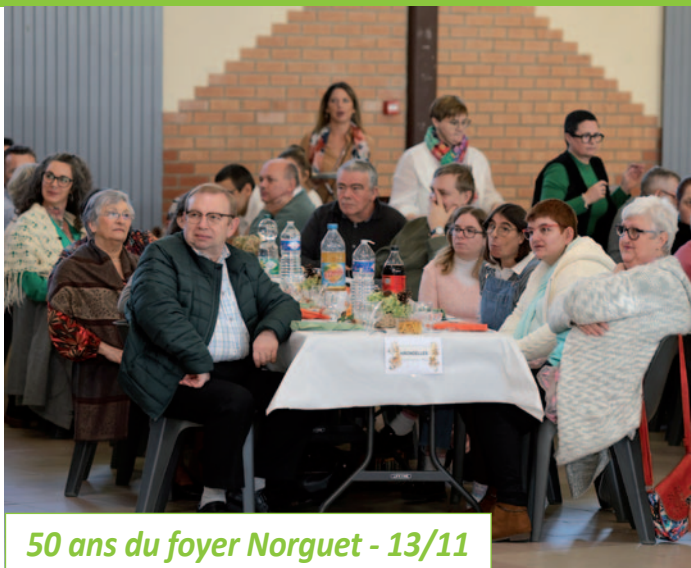
50 ans du foyer Norguet - 13/11