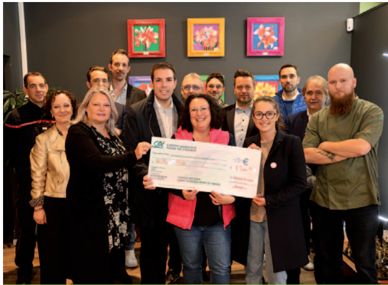
Remise de chèque à l'association Amélie Rose - 5/11