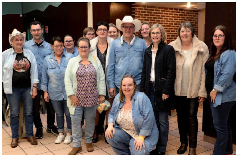
Bal de l'association Lovely Dance Country au profit du Téléthon - 2/11