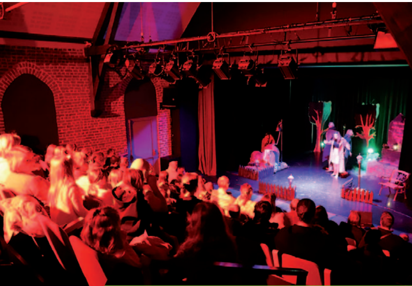
L'Homme aux cheveux d'argent - 30/10