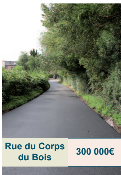
Rue du Corps du Bois 300 000€

En l'espace de 4 ans, notre ville a bénéficié de nombreux chantiers : des interventions utiles et nécessaires pour la population bruaysienne et labuissérioise. Travaux de voiries, pose de coussins berlinois, création de places de stationnement ou encore rénovation de parkings... Les équipes du service Voirie et les prestataires privés se sont attachés à améliorer sans cesse notre réseau routier.