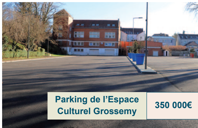
Parking de l'Espace Culturel Grossemy 350 000€

En l'espace de 4 ans, notre ville a bénéficié de nombreux chantiers : des interventions utiles et nécessaires pour la population bruaysienne et labuissérioise. Travaux de voiries, pose de coussins berlinois, création de places de stationnement ou encore rénovation de parkings... Les équipes du service Voirie et les prestataires privés se sont attachés à améliorer sans cesse notre réseau routier.