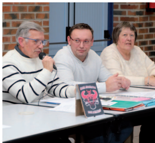
Assemblée générale de l'USOBL Musculation 24 janvier