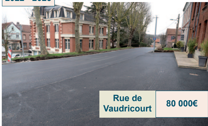
Rue de Vaudricourt 80 000€