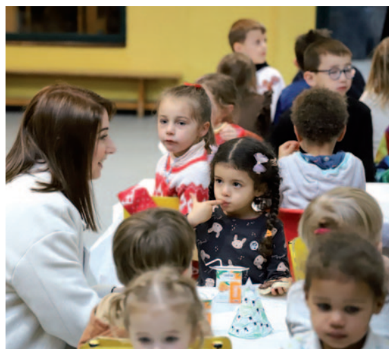
Distribution de friandises aux enfants des ACM (Accueil Collectif de Mineurs) 24 décembre