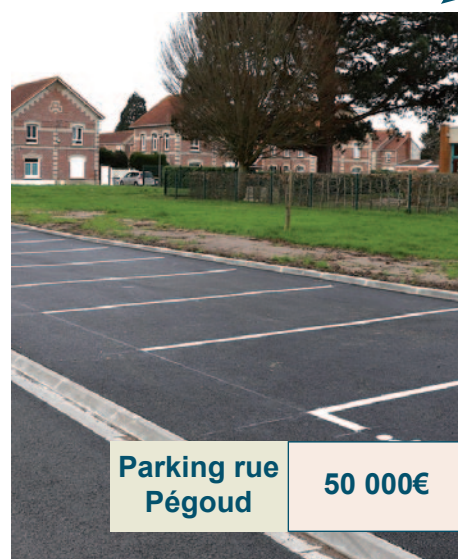
Parking rue Pégoud 50 000€

Côté sécurité, des feux tricolores ont été installés au carrefour des rues Caron et des Pyrénées . Ces travaux de sécurisation ont coûté 90 000 euros .