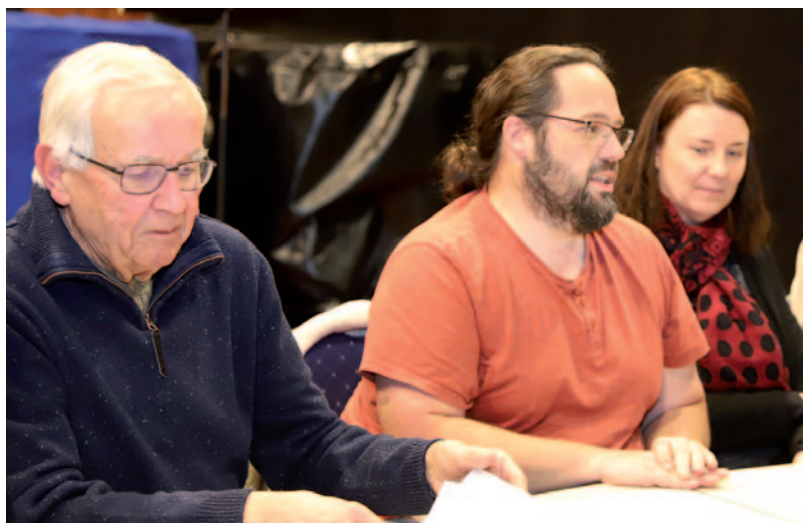
Assemblée générale de l'association Andantino 21 janvier