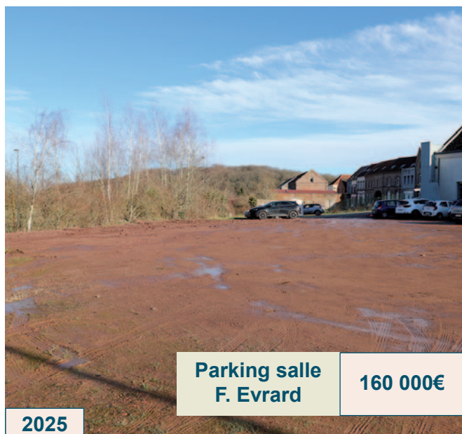
Parking salle F. Evrard

Rien n'arrête la municipalité dans sa quête de rénovation des voiries. Dès cette année et ce jusqu'en 2026, des travaux sont programmés sur divers axes routiers de la commune ainsi que sur certains parkings. Des chantiers attendus par la population tant pour le confort que pour la sécurité de tous. Cette année, les trottoirs de la rue de la Belle au Bois seront également refaits pour un montant de 40 000€