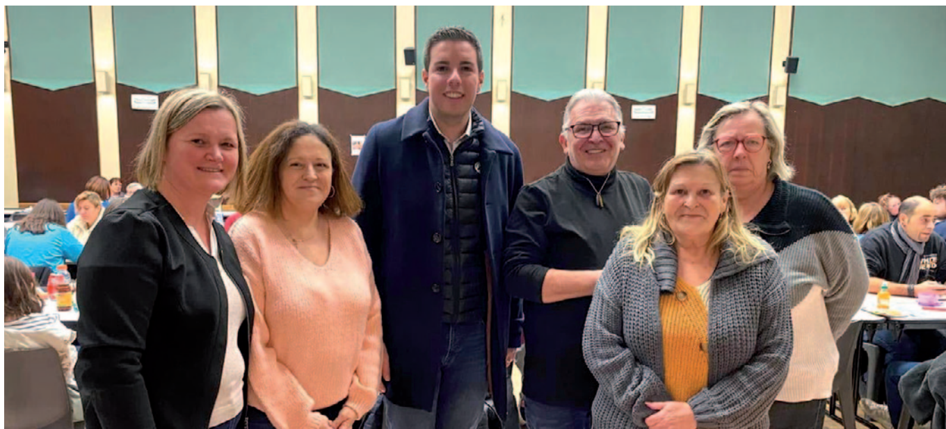
Loto solidaire par le FSE du collège Signoret, dans le cadre des actions pour notre commune jumelée de Kédougou (Sénégal)