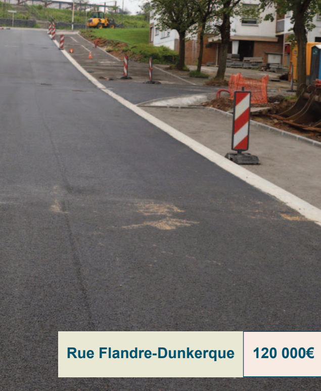
Rue Flandre-Dunkerque 120 000€