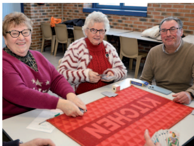
Dégustation de la galette au club de la Bonne Humeur