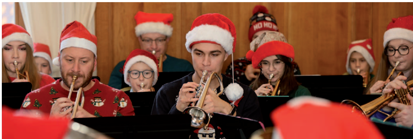
Concert de Noël du Bruay-La-Buissière Brass Band 22 décembre