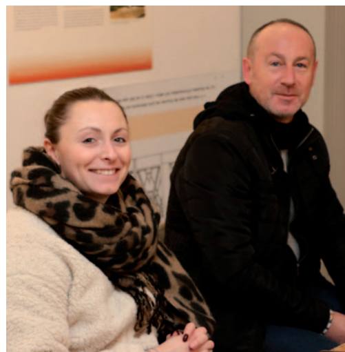
Assemblée générale du Conseil citoyen Stade-Parc/Cité 34