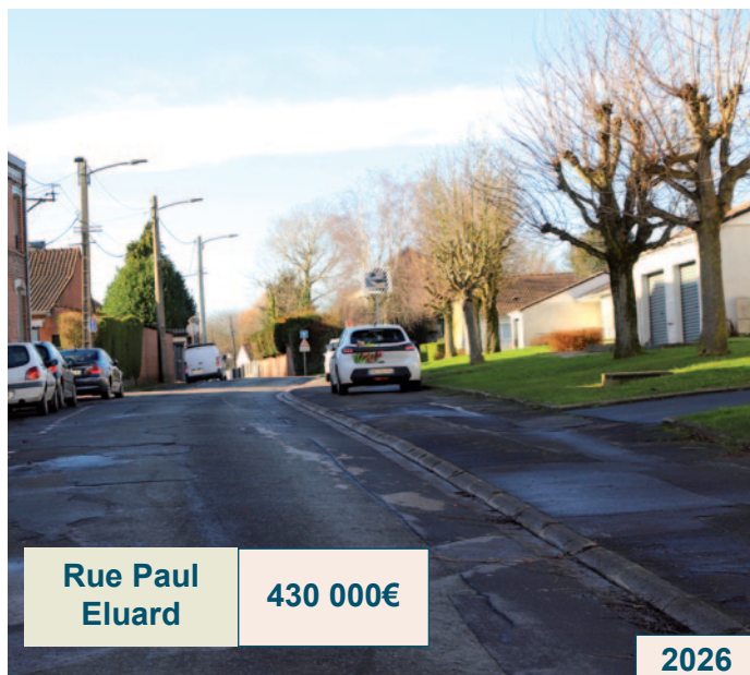
Rue Paul Eluard