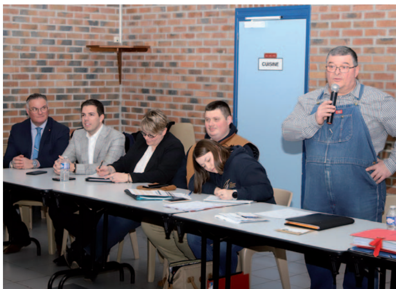
Assemblée générale de l'association "Véhicules Militaires de l'Artois" 25 janvier