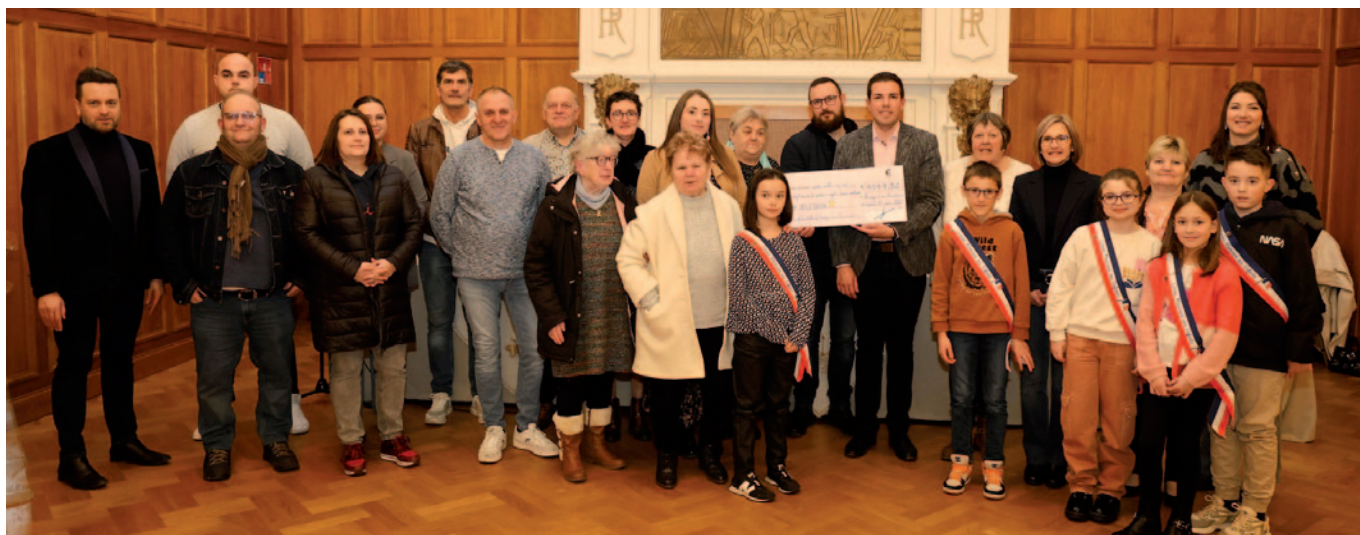
Remise de chèque à l'attention de l'AFM Téléthon : 4 547,92 euros en 2024 ! 17 janvier