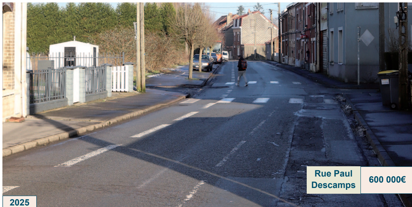
Rue Paul Descamps