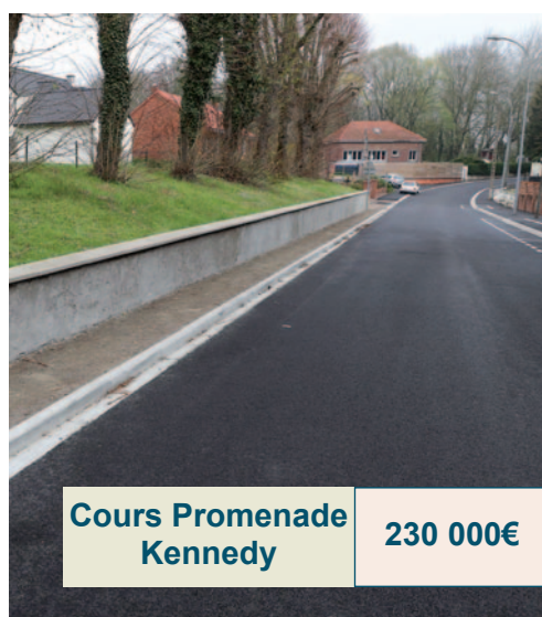
Cours Promenade Kennedy 230 000€