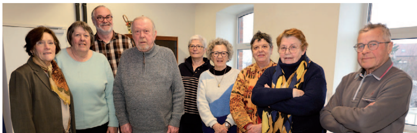
Assemblée générale de Bruay-La-Buissière Initiative 11 février