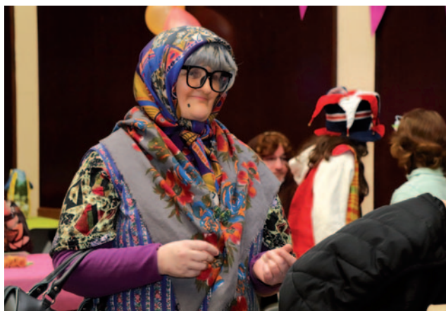
Carnaval de la Maison des échanges 22 février