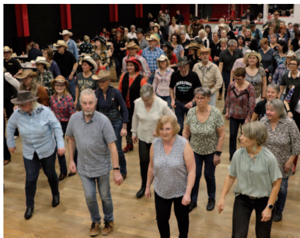
Danse avec Bruay Country' Squad 1 er février