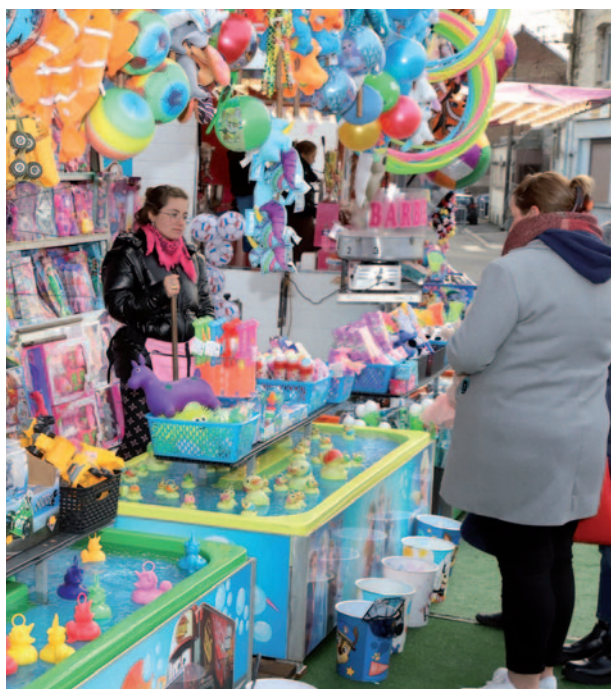
Foire d'hiver du comité des fêtes du quartier de la Gare Du 7 au 22 février