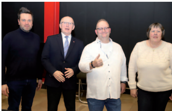
Assemblée générale du club de marche Les Chamois 8 février