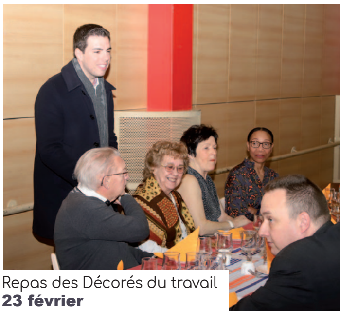
Repas des Décorés du travail 23 février