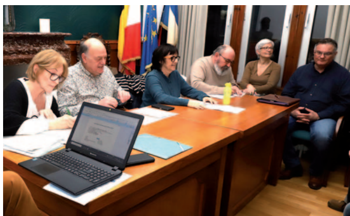
Assemblée générale de l'association Bruaysienne pour la Culture (ABC) 6 février