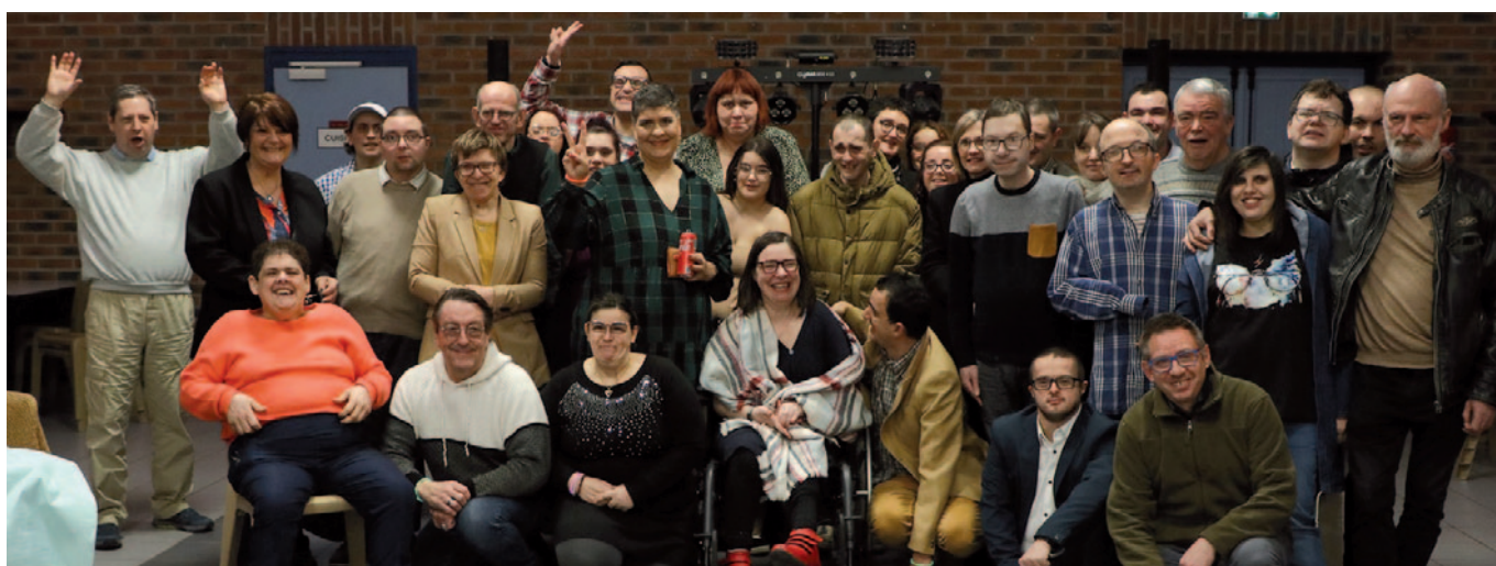
Soirée dansante de l'APEI de Béthune 1 er février