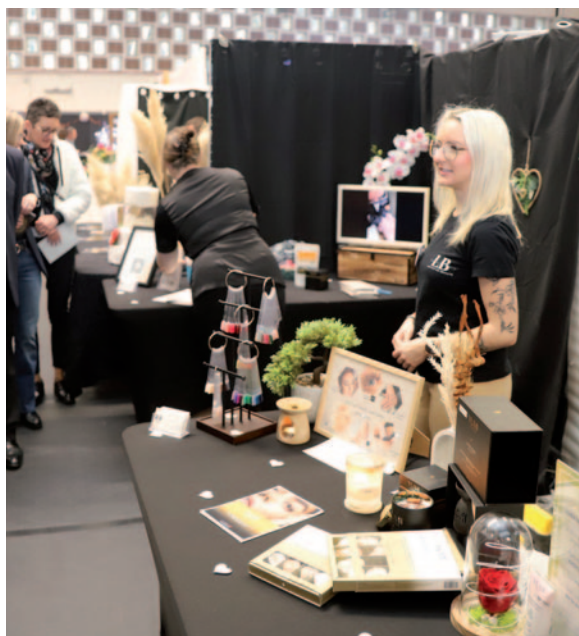
Salon du mariage 9 février