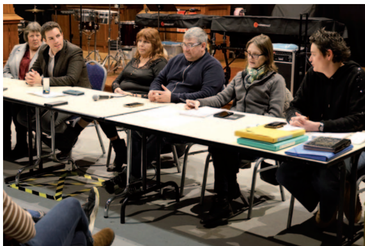
Assemblée générale de l'Harmonie municipale de Bruay-La-Buissière 30 janvier