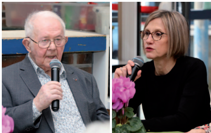
Assemblée générale du club Amitié et Loisirs 22 février