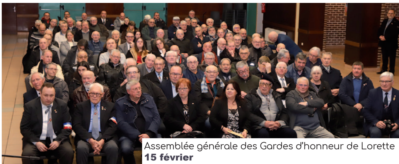
Assemblée générale des Gardes d'honneur de Lorette 15 février