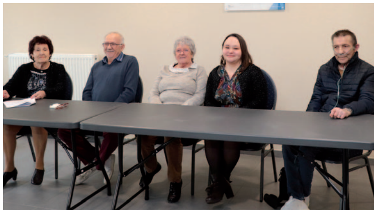
Assemblée générale de l'association Vie libre 8 février