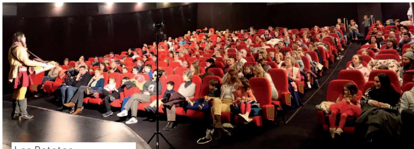
Les Rototos Du 9 février au 9 mars