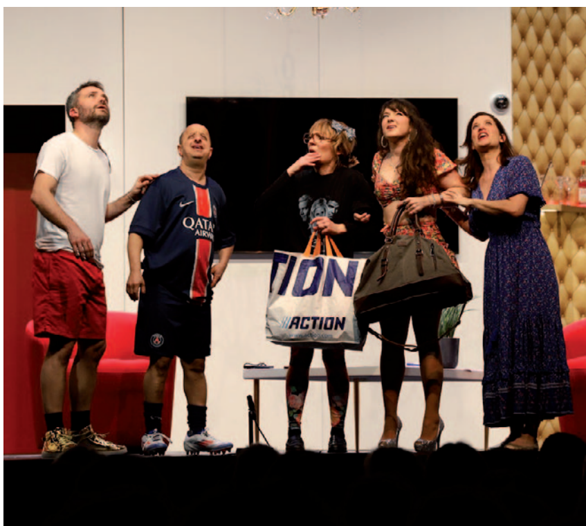
Théâtre "Le Casse de l'Année" 22 février