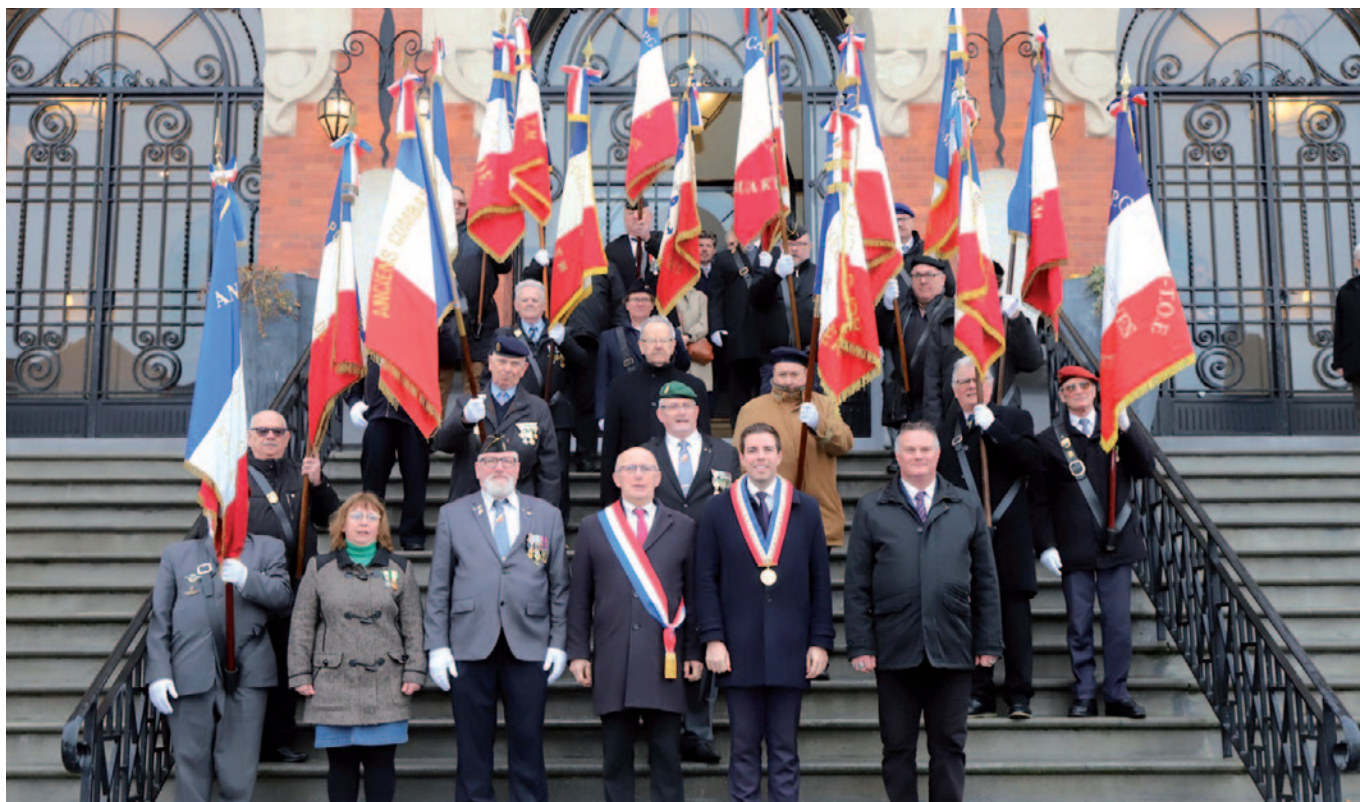
Assemblée générale des anciens combattants de l'arrondissement de Béthune 22 février