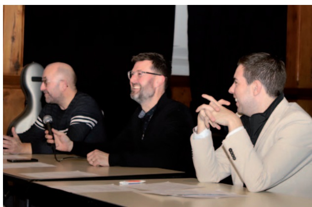
Assemblée générale de l'orchestre symphonique 6 février