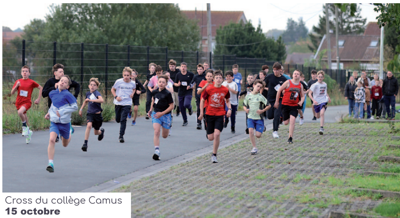
Cross du collège Camus 15 octobre