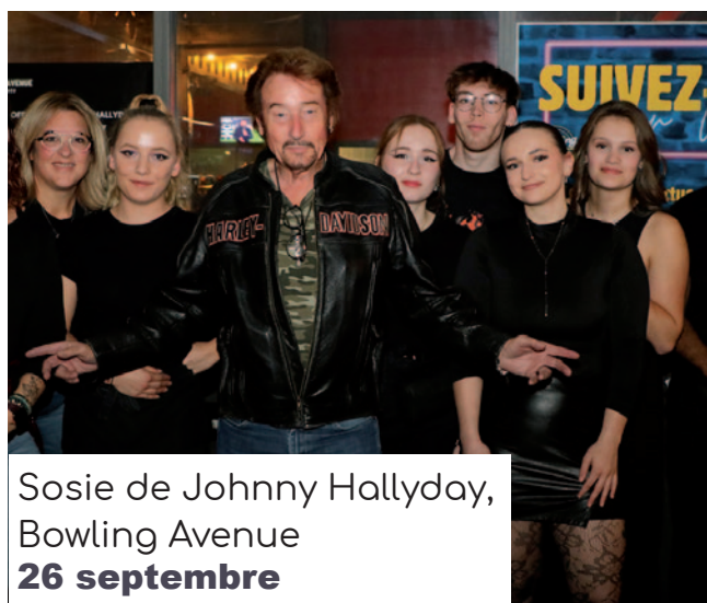
Sosie de Johnny Hallyday, Bowling Avenue 26 septembre