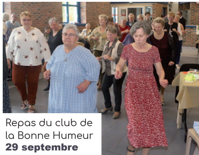
Repas du club de la Bonne Humeur 29 septembre