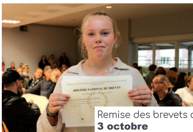
Remise des brevets au collège Rostand 3 octobre