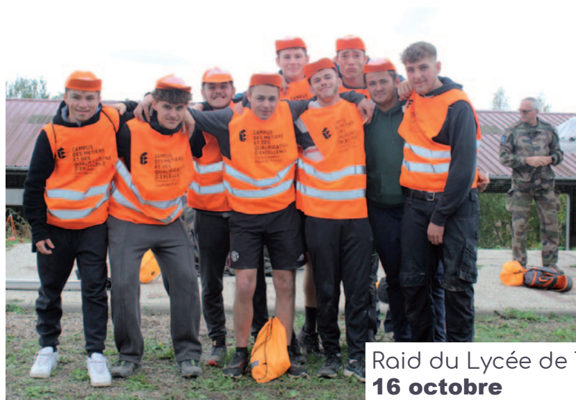
Raid du Lycée de Travaux Publics Jean Bertin 16 octobre