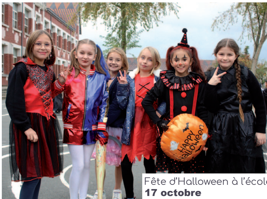
Fête d'Halloween à l'école Marmottan 17 octobre