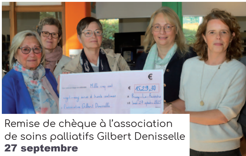
Remise de chèque à l'association de soins palliatifs Gilbert Denisselle 27 septembre