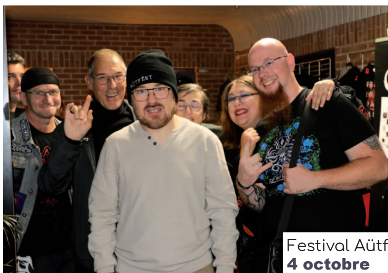
Festival Aütfest 4 octobre