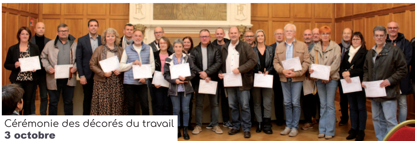
Cérémonie des décorés du travail 3 octobre