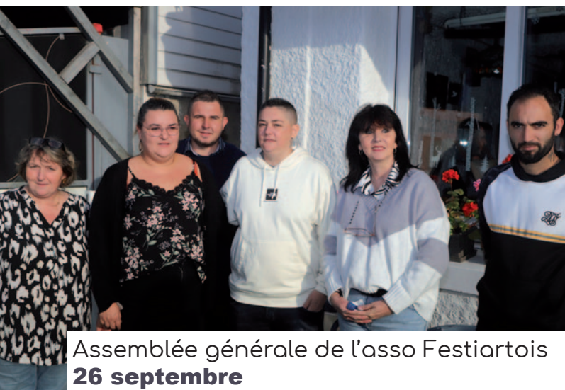
Assemblée générale de l'asso Festiartois 26 septembre