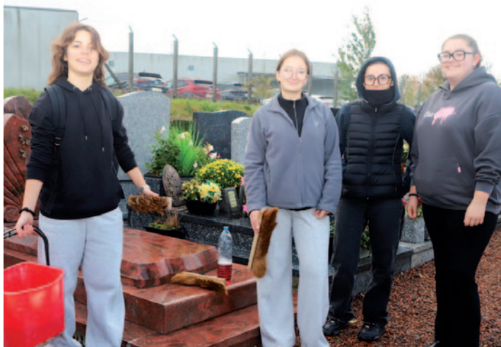
Brigade solidaire du lycée Carnot pour le nettoyage des sépultures 17 octobre