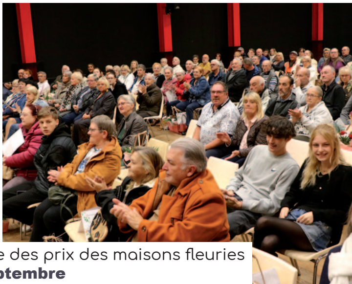
Remise des prix des maisons fleuries 26 septembre