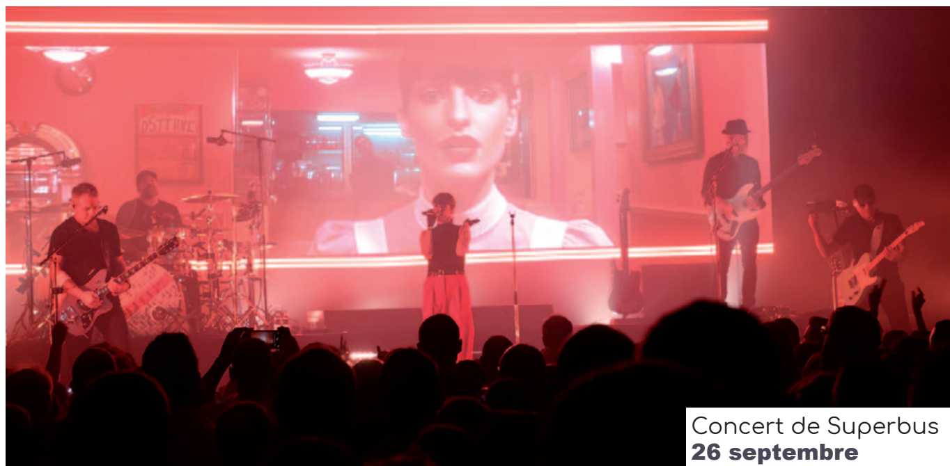
Concert de Superbus 26 septembre