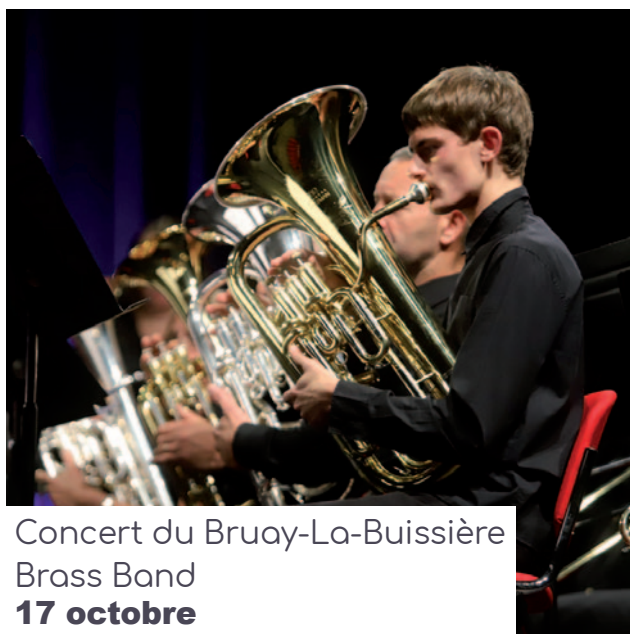
Concert du Bruay-La-Buissière Brass Band 17 octobre