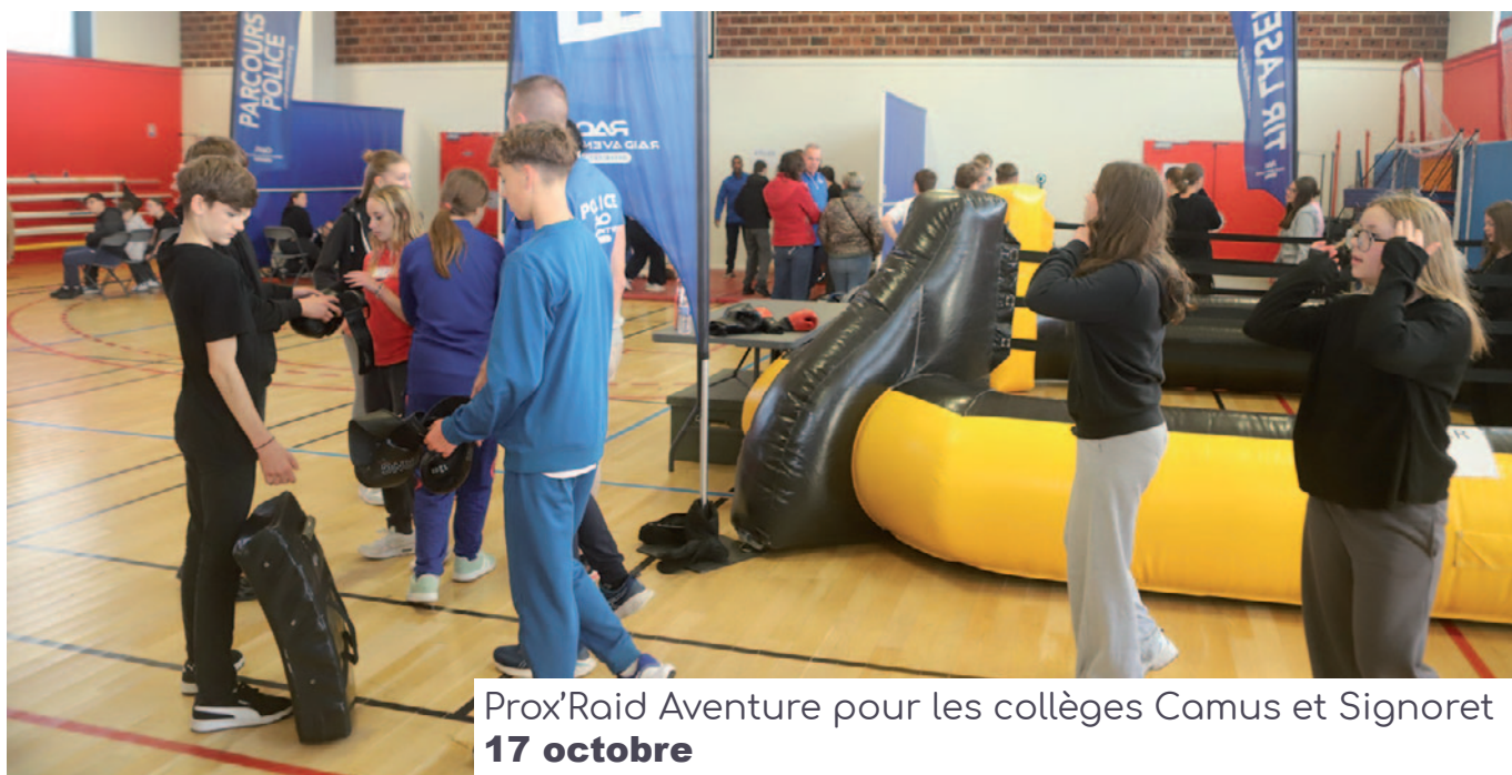
Prox'Raid Aventure pour les collèges Camus et Signoret 17 octobre