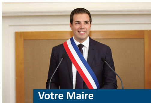
Votre Maire et Conseiller départemental