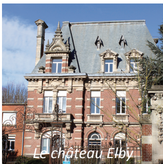
Le château Elby