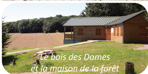
Le bois des Dames et la maison de la forêt