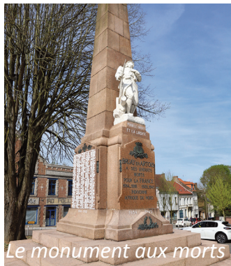
Le monument aux morts