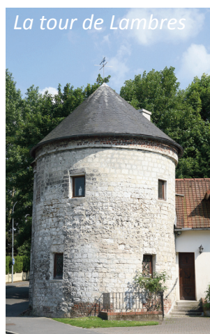
La tour de Lambres