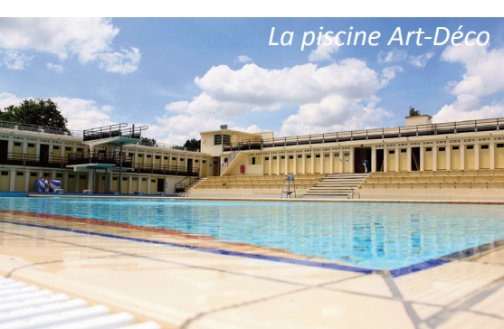
La piscine Art-Déco