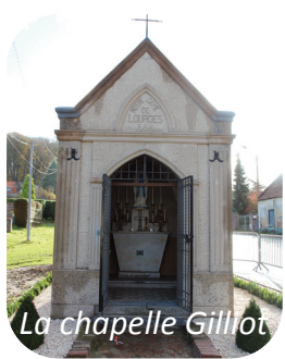
La chapelle Gillot