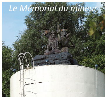
Le Mémorial du mineur