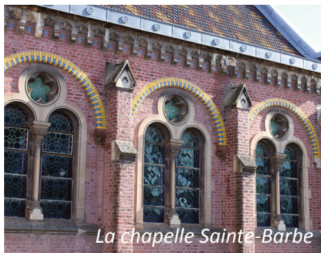
La chapelle Sainte-Barbe