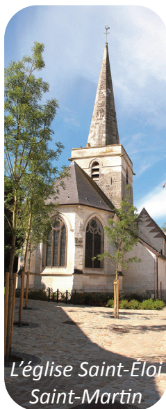
L'église Saint-Éloi Saint-Martin