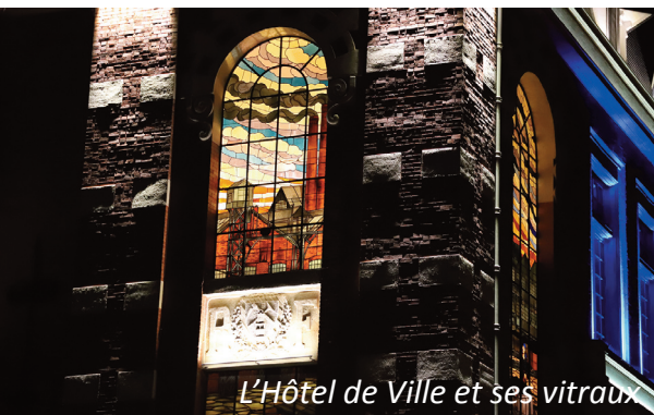
L'Hôtel de Ville et ses vitraux