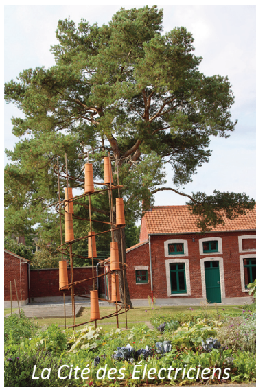
La Cité des Électriciens