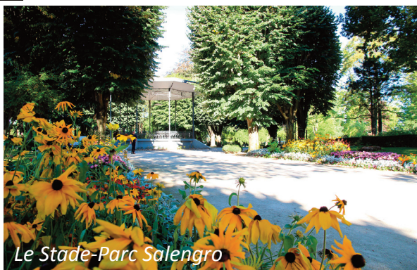
Le Stade-Parc Salengro