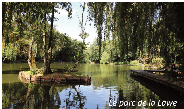
Le parc de la Lawe