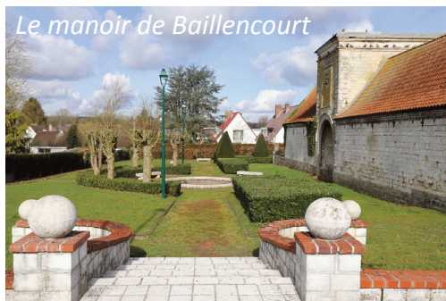
Le manoir de Baillencourt