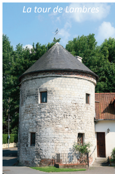
La tour de Lambres