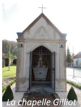
La chapelle Gilliot