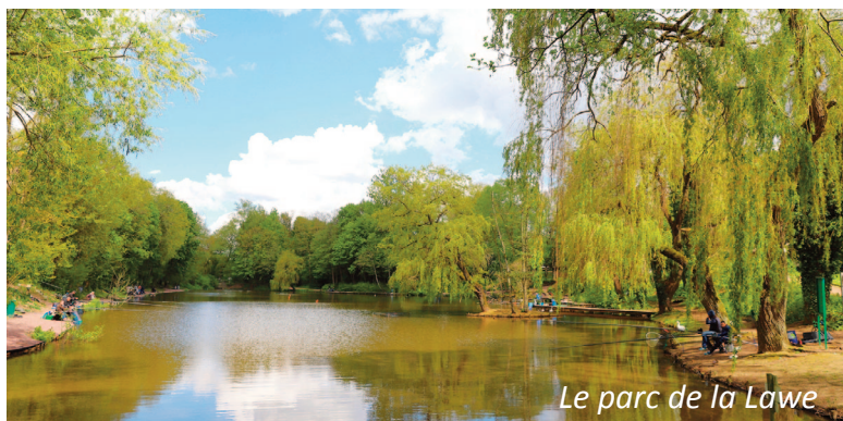
Le parc de la Lawe