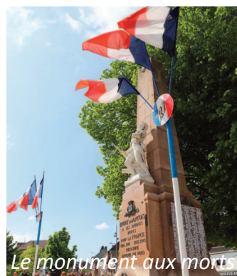
Le monument aux morts