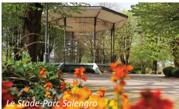
Le Stade-Parc Salengro