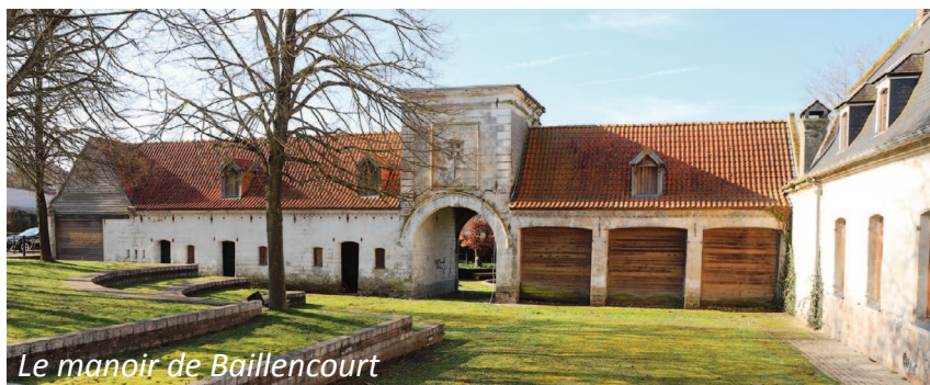
Le manoir de Baillencourt