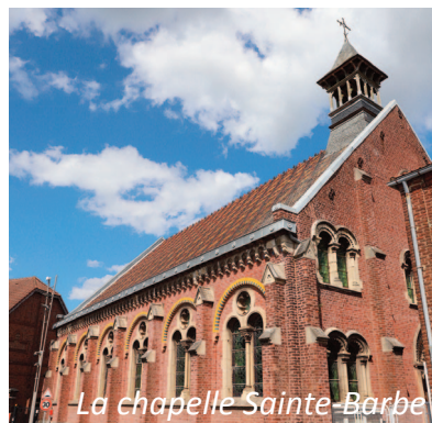
La chapelle Sainte-Barbe