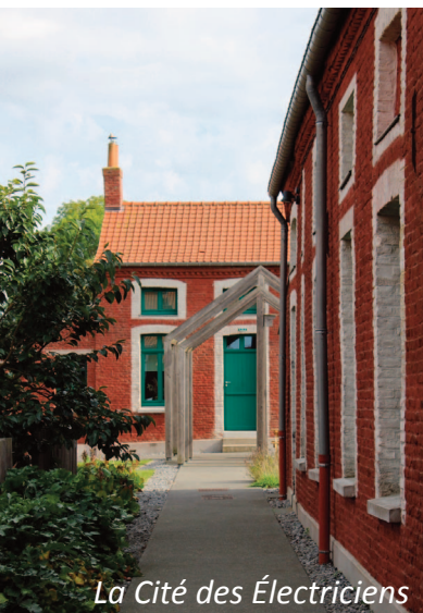
La Cité des Électriciens