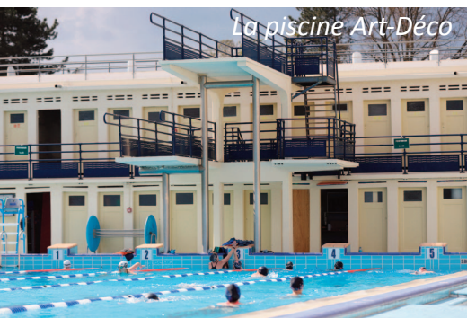
La piscine Art-Déco