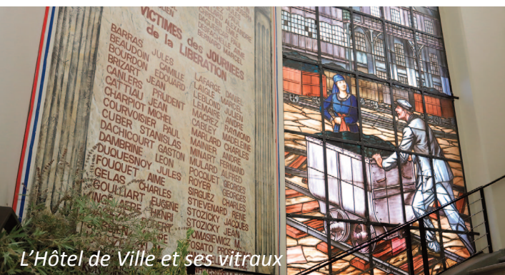
L'Hôtel de Ville et ses vitraux