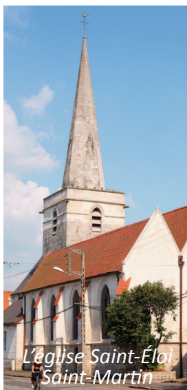
L'église Saint-Éloi Saint-Martin