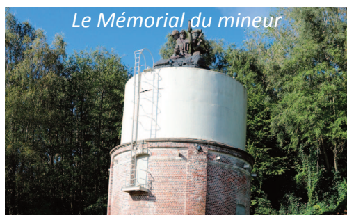
Le Mémorial du mineur