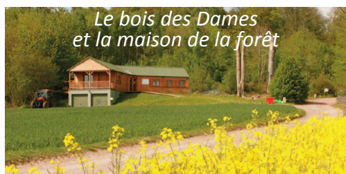
Le bois des Dames et la maison de la forêt